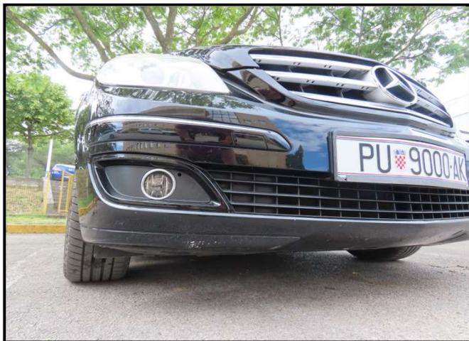
Ogreban branik prednji