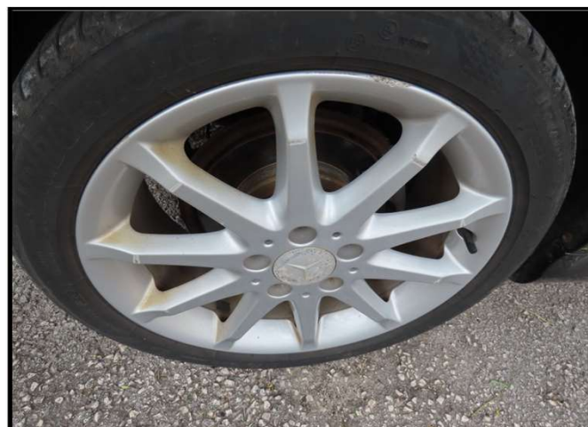
Oštećenje naplatka stražnjeg desnog