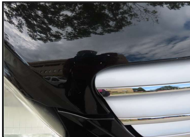
Oštećenje poklopca motora od kamenčića