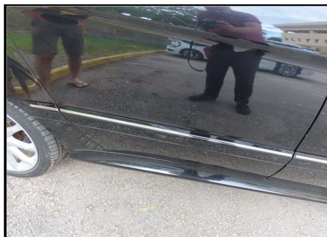
Oštećena vrata stražnja desna