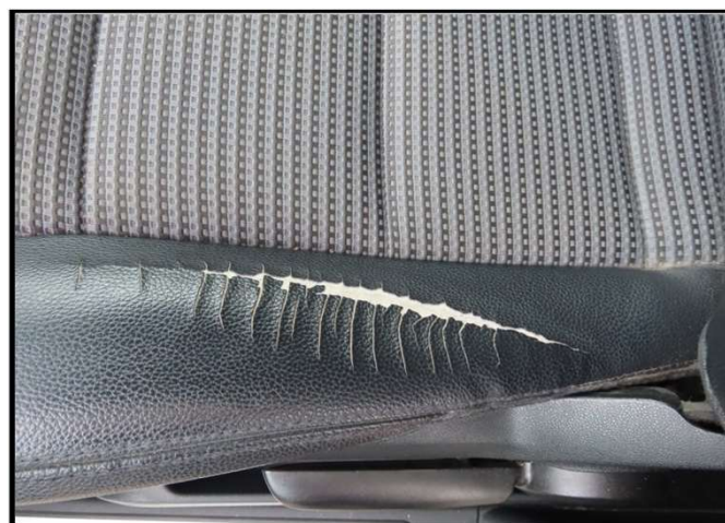
Potrgano sjedalo vozača