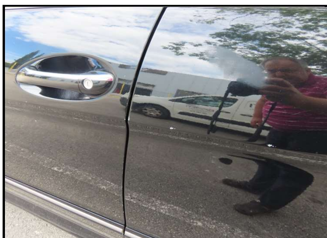
Ogrebana vrata prednja i stražnja lijeva