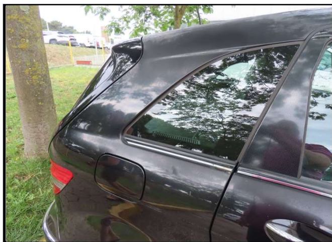
Otpadanje završnog laka bočne stijene stražnje desne