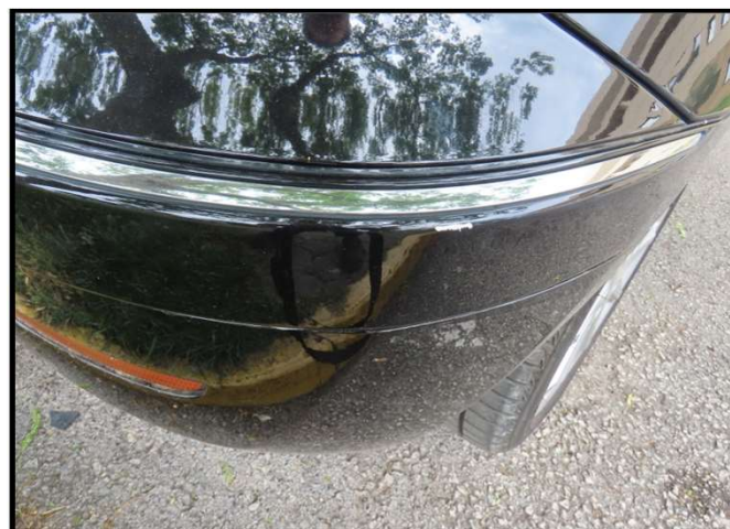
Ogreban branik stražnji na više mjesta