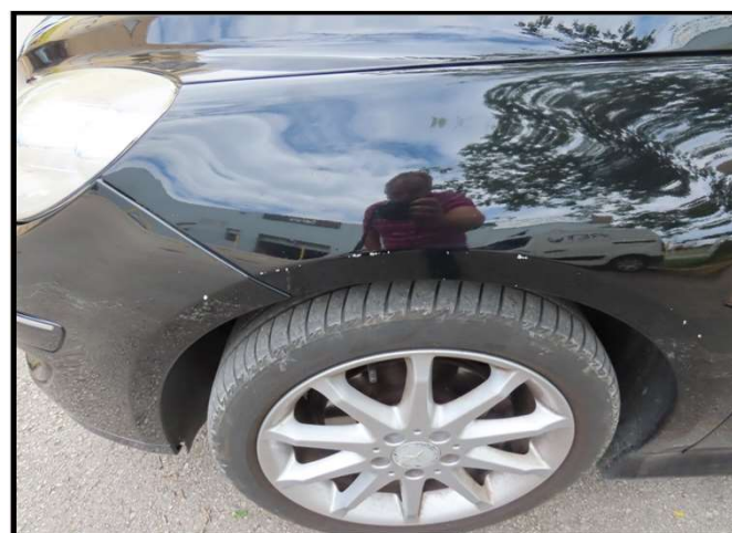
Ogreban branik prednji i blatobran prednji lijevi