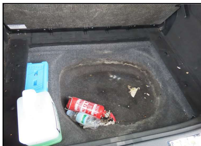
Propuštanje vode u prtljažnom prostoru